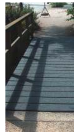
RESA-RESIST RESA Die umweltfreundliche Beschichtung von Verkehrsflächen, Belägen, Beton und Holz