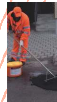
RESAphalt RESA Die einfach und kalt verarbeitbare, reaktiv aushärtende Reparaturmasse mit der hohen Umweltverträglichkeit