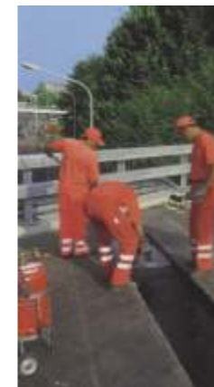
THORMA-JOINT RESA Der bewährte Fahrbahnübergang mit optimaler Belagskontinuität