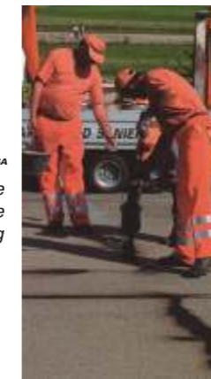
RESA-Riss RESA Die schonende und effiziente Rissanierung