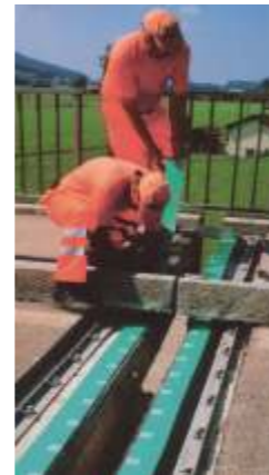
SILENT-JOINT RESA Der geräuscharme und dauerhafte Fahrbahnübergang der Extraklasse

Wir streben die Spitzenposition der Branche an und betrachten uns als Standardsetter - sowohl im Bereich der verwendeten Materialien als auch in der Qualität der Ausführung.