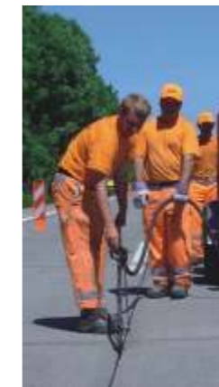
RESA-FUGEN RESA Die dauerhafte und dichtende Fugensanierung