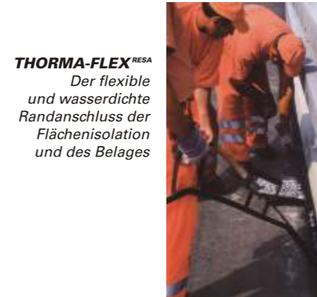
THORMA-FLEX RESA Der flexible und wasserdichte Randanschluss der Flächenisolation und des Belages