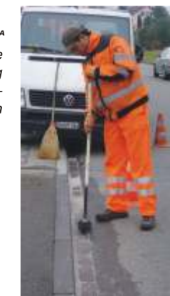
RESA-BORD RESA Effiziente Instandsetzung von Strassenabschlüssen