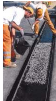
EASY-JOINT RESA Der geräuscharme, fugenlose Fahrbahnübergang aus Asphalt