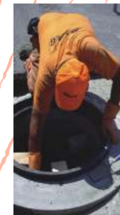
RESA-SCHACHT RESA Die Express-Schachtdeckel-Sanierung